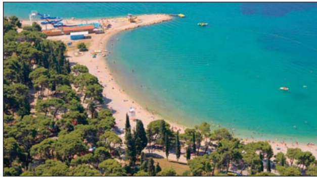
LETECKÝ POHLED na kemp Park Soline, ve kterém se adaptační a ozdravný pobyt uskuteční.

Adaptační a ozdravný pobyt se týká všech dětí, které jsou zapsány do prvních tříd Základní školy Gen. Janka ve školním roce 2015/2016. Podrobné informace mohou rodiče získat na telefonním čísle 596 622 284, prostřednictvím e-mailu ředitelnaZS@zsgenjanka.cz anebo na webových stránkách školy www.zsgenjanka.cz, kde je rovněž k dispozici ke stažení i přihláška na akci.