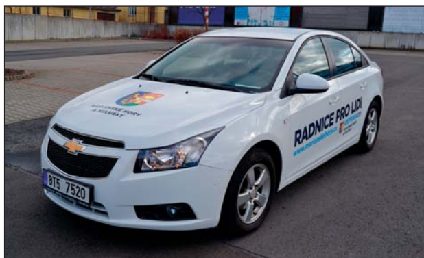
SLUŽEBNÍ AUTOMOBIL značky Chevrolet dříve sloužil pro potřeby místostarostů obvodu. Nyní bude vozit seniory a zdravotně postižené k lékaři a na rehabilitace.

Podmínkou pro využití služby je trvalý pobyt v městském obvodu Mariánské Hory a Hulváky. Služba je k dispozici v pracovní dny od 7 do 15 hodin a jízdu je potřeba si objednat na telefonním čísle 599 459 200 alespoň jeden den předem v pracovních dnech od 8 do 14 hodin.